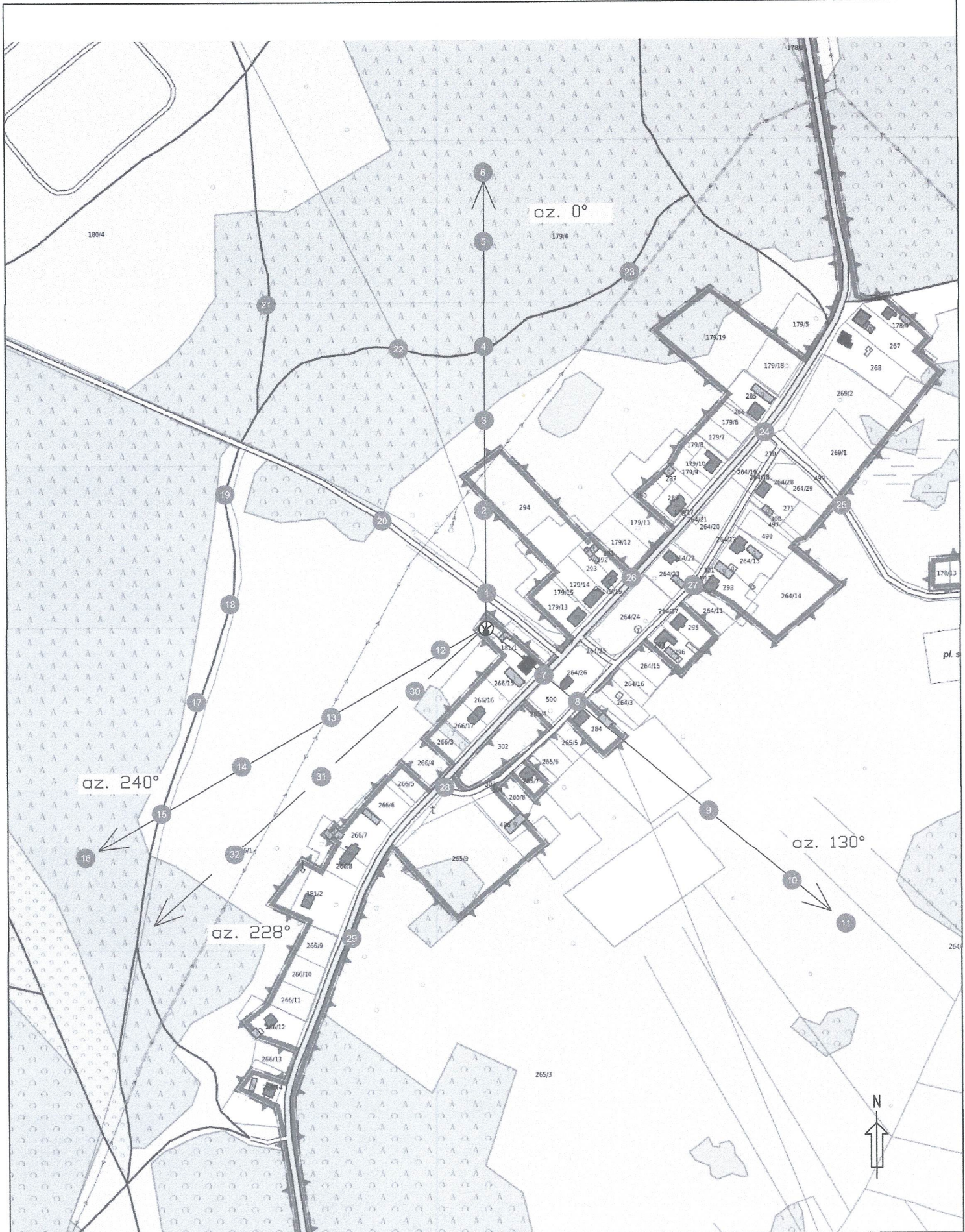
Rys.1 Lokalizacja pionów pomiarowych

Legenda ● Pion pomiarowy — Antena sektorowa ⊗ Instalacja będąca źródłem pola elektromagnetycznego skala 1:3000 - - - Antena paraboliczna